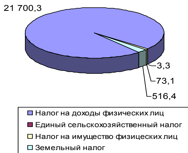
Рис. 1 Структура налоговых доходов бюджета поселения

Наглядно структуру поступления налоговых доходов можно представить на рис. 1