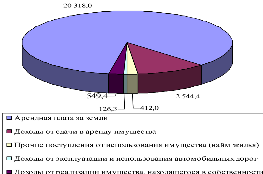
Рис. 2 Структура неналоговых доходов бюджета поселения

Доля безвозмездных поступлений за отчетный период, по сравнению с аналогичным периодом 2009 года, увеличилась на 114,4 % и составила 77 040,5 тыс. рублей, это 62,5 % от общего объема поступивших в бюджет поселения доходов. Из них: